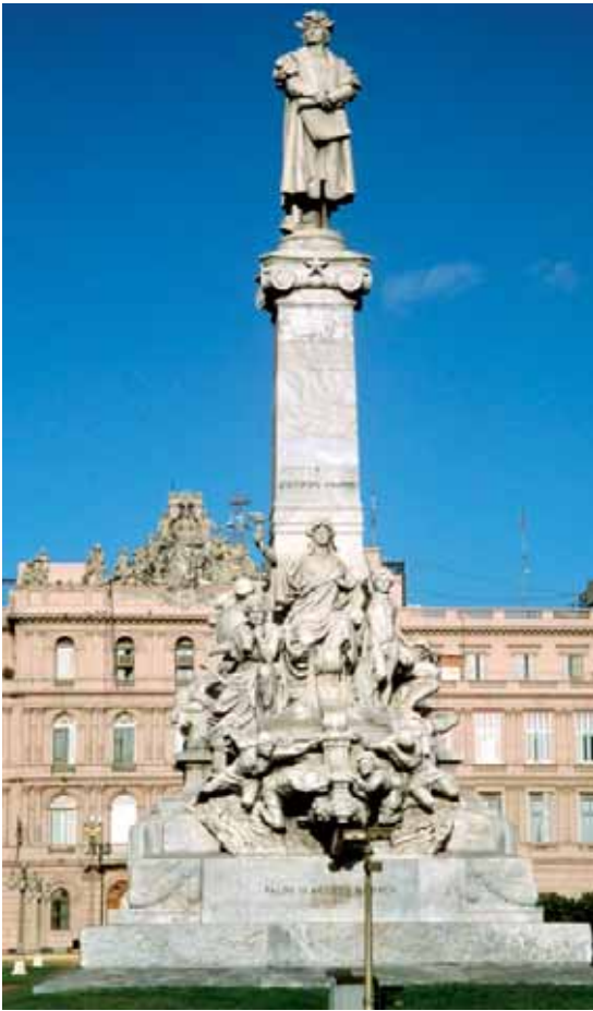
Das Kolumbus-Denkmal in der argentinischen Hauptstadt Buenos Aires (Foto, 1998).

lich vor rund 30 000 Jahren ganz ausstarb. Der Entdeckungsdrang unserer Vorfahren war nicht nur geografischer Art, auch das Wissen um die Beherrschung der Natur trieb sie stetig voran. Das späteiszeitliche mitteleuropäische Klima verlangte ihnen nämlich ungekannte geistige Leistungen ab, die ein Überleben erst ermöglichten, v. a. in der Kunst der Werkzeugherstellung. Daraus erwachsen, in etwa zur Zeit des Aussterbens der Neandertaler, die ersten menschlichen Kunstwerke, die wir heute kennen und noch bewundern können, so die Felszeichnungen in französischen Höhlen und verzierte Artefakte aus Horn. Bis in die heutige Ukraine und entlang des Ural, ja sogar bis nördlich des Polarkreises waren unsere Urahnen bereits vorgedrungen, als vor etwa 15 000 Jahren die letzte Eiszeit endete. Von tropischer Hitze bis zu polarer Kälte hatten sie bei ihrer ersten Welteroberung schon alle Klimaextreme kennengelernt und bewältigt.