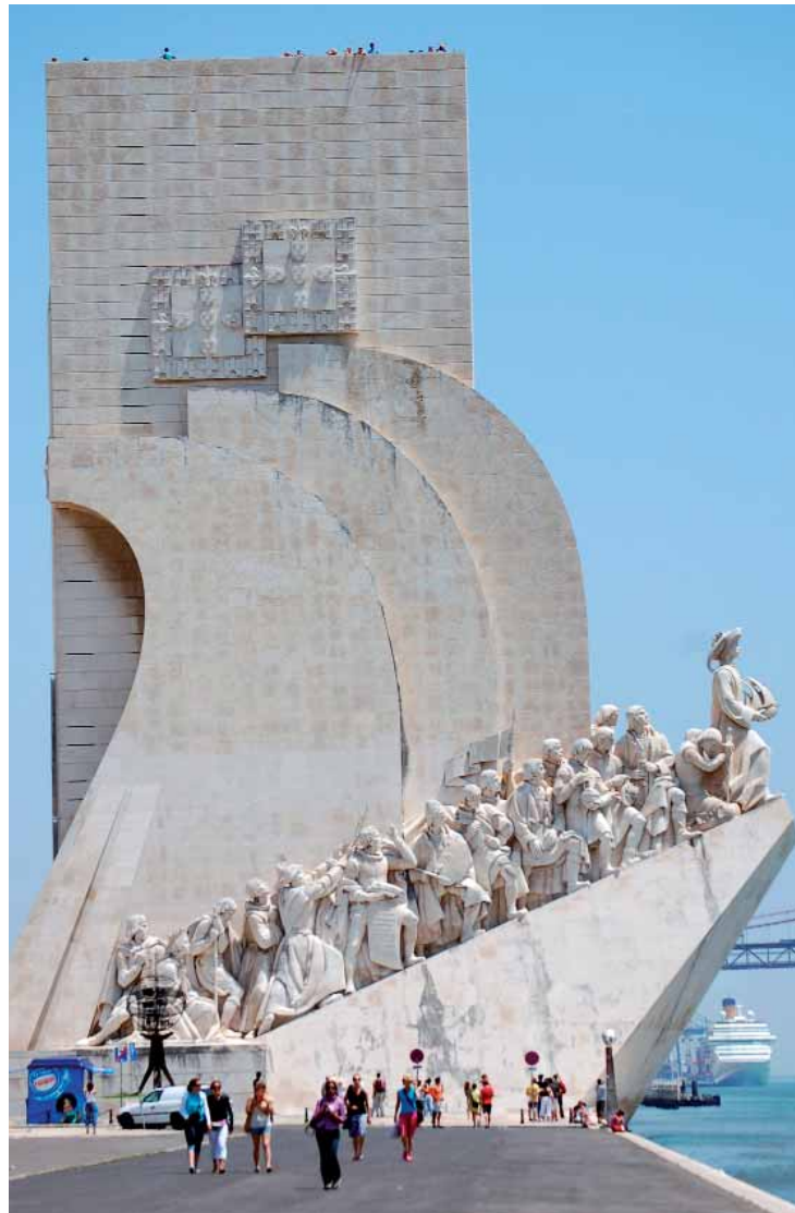
Das 1960 zu Ehren des 500. Todestages von Heinrich dem Seefahrer erbaute „Monumento dos Descobrimentos“ im Stadtviertel Belém in Lissabon (Foto, 2006).

Damit wird ein weiterer Schwerpunkt dieses Buches berührt: die Eroberer. Wie die Entdecker das Antlitz der Welt erkundeten, so veränderten jene es. Wenngleich heute auch die moralische Fragwürdigkeit von Eroberungszügen mehr im Vordergrund steht als in früheren Zeiten, kann man den großen Eroberern eine gewaltige Wirkung ihres Tuns natürlich nicht absprechen. Als der Makedonier Alexander, den wir heute als den Großen kennen, gegen die Perser zu Felde zog, setzte damit sein atemberaubender Aufstieg zum Herrscher über fast die gesamte damals bekannte Welt ein. Die darauf folgende Verbreitung der griechischen Kultur wirkt bis heute nach, wenngleich die unterworfenen Völker ob der Verdrängung ihrer angestammten Traditionen und Lebensweisen keineswegs erfreut waren. Derart zwiespältig stellen sich die Taten und die Persönlichkeiten der meisten epochalen Eroberer dar, ob nun Alexander, Caesar oder Hannibal. Ihre Unternehmungen waren naturgemäß blutdurchwirkt, und ein Schaudern packt den heutigen Betrachter bei der Kaltblütigkeit, mit der sie Abertausende in den Tod schickten. Umso mehr üben die überragenden Feldherren die Faszination des Rätselhaften, des mit normalen humanen Maßstäben Unverträglichen aus.