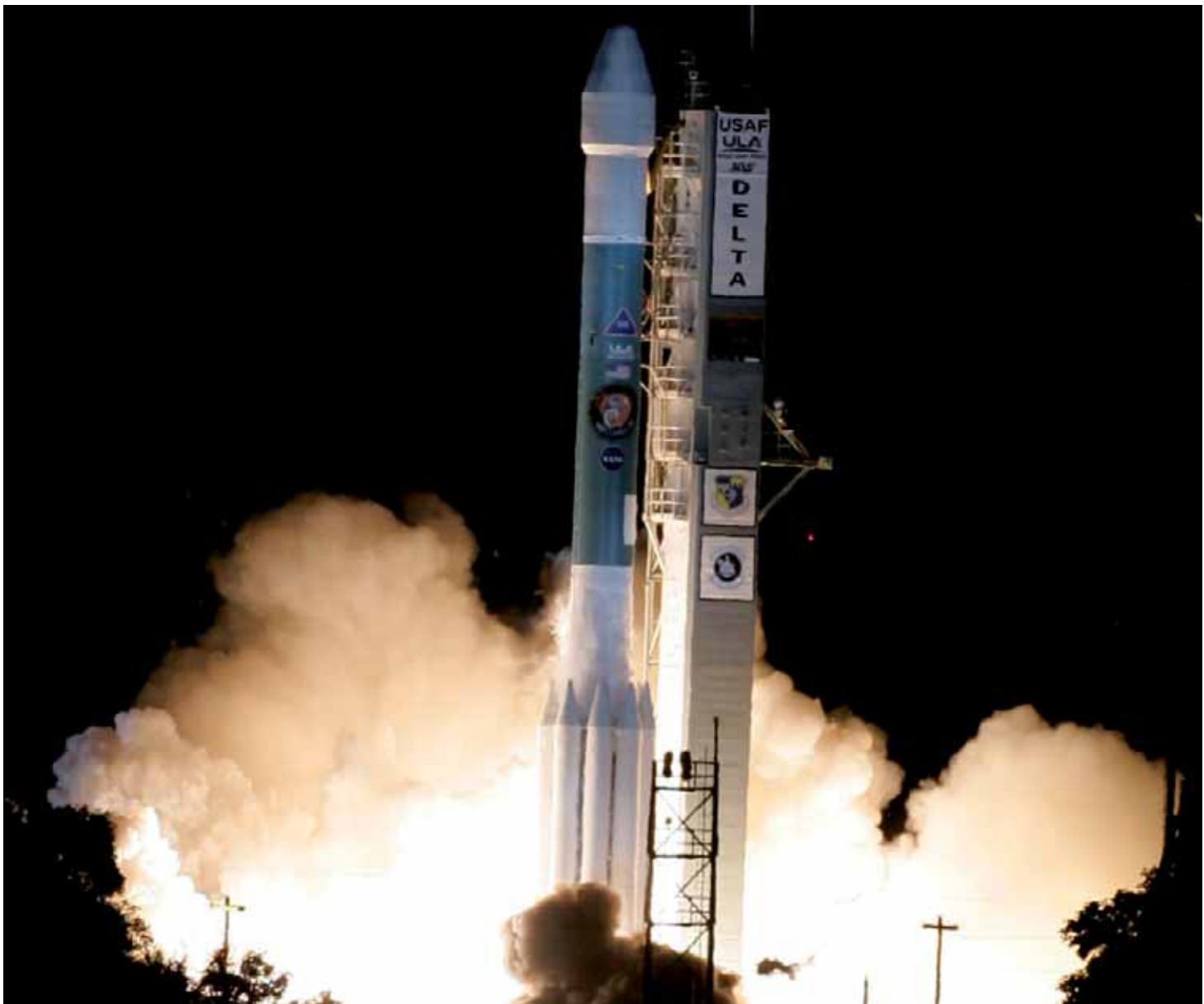
Die Sonde „Phönix“ startet zum Mars, Cape Canaveral, Florida (Foto, 2007).

Doch zunächst können Sie Ihre eigene Entdeckungstour unternehmen: Gehen Sie auf die Reise mit den großen Forschern, Pionieren und Feldherren der Geschichte, erfahren Sie, wer hinter den epochalen Taten und Erkenntnissen steht, die unsere Welt zu der gemacht haben, die sie heute ist. Wir wünschen Ihnen ein spannendes und lehrreiches Lesevergnügen.